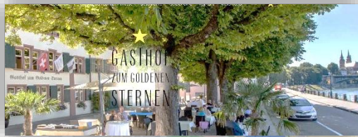
Gasthof zum Goldenen Sternen